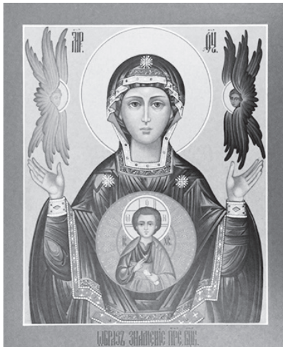
Икона Божией Матери «Знамение». Современное письмо.

7 декабря — Вмц. Екатерины († 305-313 г.).