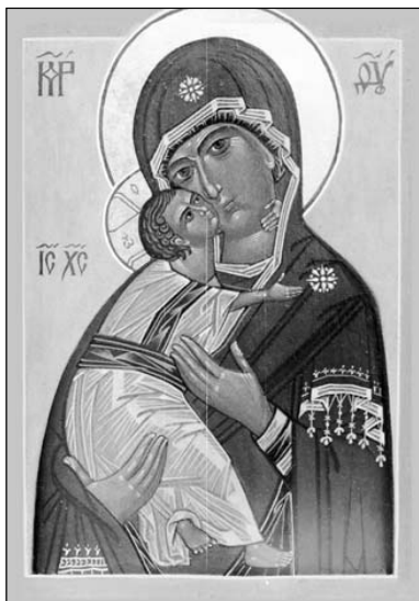
Владимирская икона Божией Матери. Сийская иконописная мастерская.

Святитель Иов — первый наш русский патриарх. Был деятельным главой Русской Церкви. При нем открыто несколько монастырей, прославлены многие святые, развивалось книгопечатание, строились храмы — это способствовало развитию зодчества, иконописи, ювелирного искусства, художественных ремесел. Когда в Россию вторглись поляки, поддержавшие Лжедмитрия, святитель выступил против самозванца, убеждал народ, что нельзя доверять Лжедмитрию и полякам. Был отправлен в заточение, где он скончался 19 июня (2 июля) 1607 года.