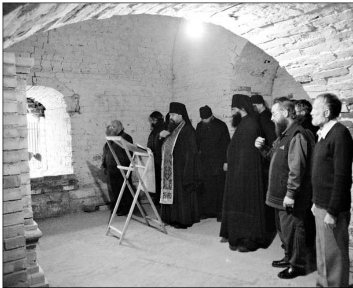
Молебен Сийским святым совершается в 3-ю Неделю (воскресенье) по Пятидесятнице.