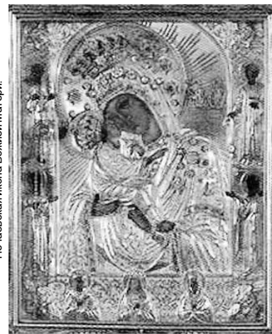
Почаевская икона Божией Матери.

4 августа — мироносицы равноапостольной Марии Магдалины.