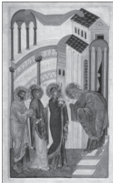
Сретение. Современная икона

Празднование было установлено для того, чтобы прекратить споры, кто из этих трех святителей выше.