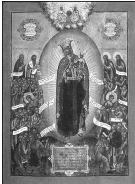
Всех скорбящих Радосте. Кон. XVII — нач. XVIII вв. Москва, ГТГ.

6 ноября — иконы Божией Матери «Всех скорбящих радости».