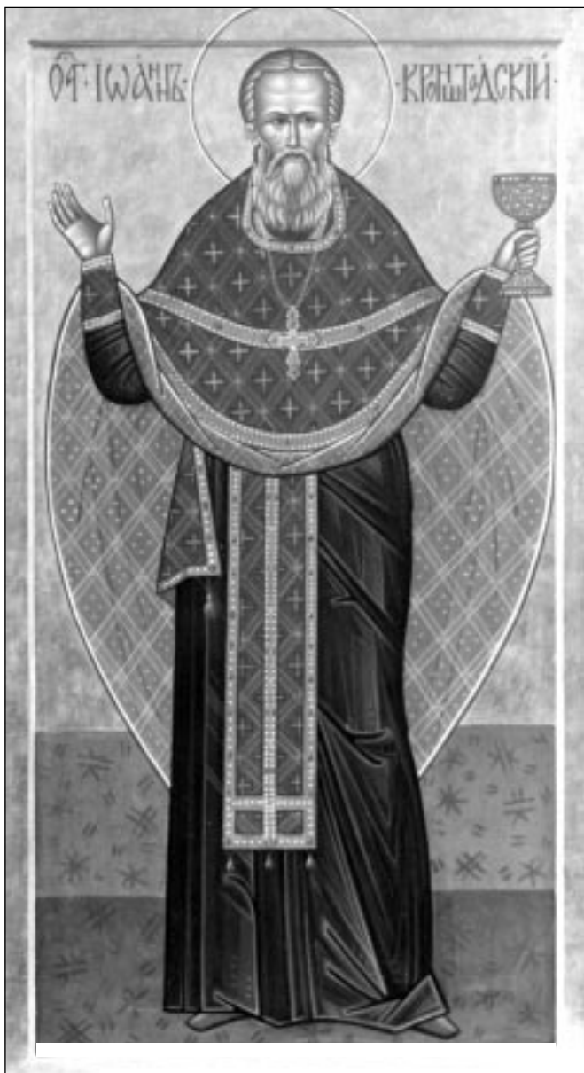
Св. прав. Иоанн Кронштадтский. Игорь Лапин. Сильская иконописная мастерская. 2002 г.

4-6 ноября в Архангельске состоятся Пятое Иоанновские образовательные чтения.