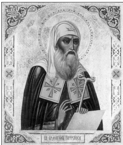
Священномученик Ермоген, Митрополит Московский.

Патриаршее служение Ермогена проходило в годы Смутного времени — нашествия польских интервентов и внутренних раздоров. Особенно ревностно Патриарх боролся с попытками искоренить в России Православие, ввести униатство и католичество. Грамоты, рассылаемые Ермогеном по всей стране, побуждали народ к освобождению Москвы от врагов и избранию законного русского царя. Поляки заключили святого в Чудов монастырь, где он скончался от голода.