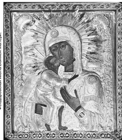
Феодоровская икона Божией Матери.

На богослужении в этот день (воскресном всенощном бдении) священнослужители выносят крест из алтаря и полагают его на аналое посреди храма. Совершается троекратное поклонение кресту. При этом все присутствующие поют: «Кресту Твоему поклоняемся, Владыко, и святое Воскресение Твое славим». Крест остается на середине храма до пятницы.