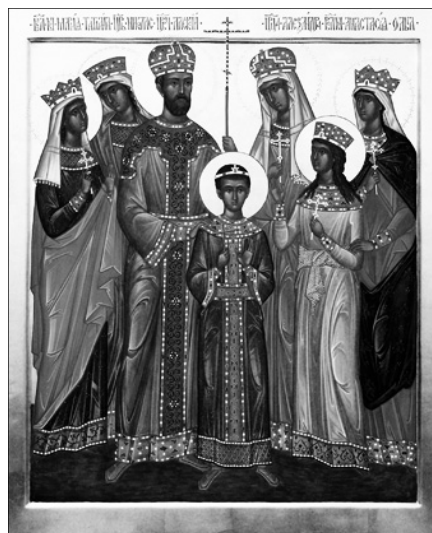
Царские страстотерпцы. Сийская иконописная мастерская.

16 июля — перенесение мощей свт. Филиппа, митр. Московского и всея России, чудотворца (1652 г.). Сщмч. Антония, архиепископа Архангельского († 1931 г.). Прпп. Иоанна и Лонгина Яренских († 1544-1545 гг.). Прп. Николая Кожеезерского († 1640 г.).