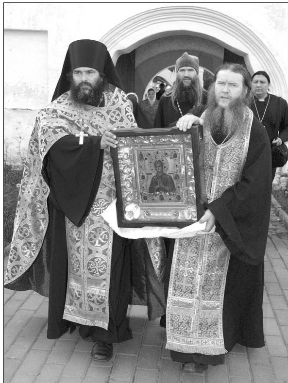
Икона «Семистрельная» в Антониево-Сийском монастыре. Фото иерод. Феофила.

«Православие на Северной земле»/Пресс-служба Архангельской епархии.