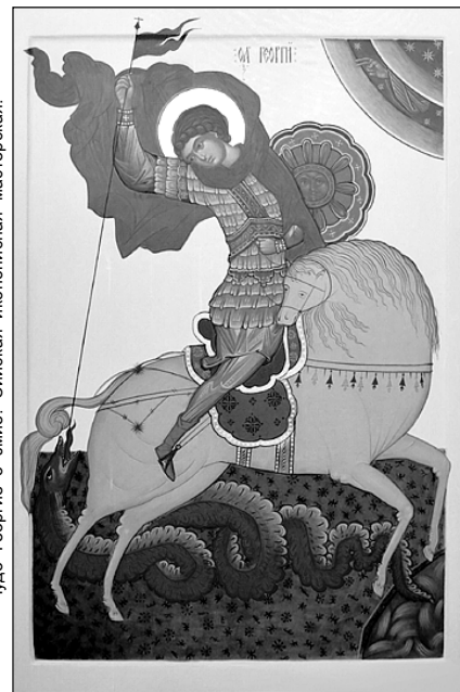
Чудо Георгие о змие. Сийская иконописная мастерская.

3 мая — память прп. Александра Ошевенского († 1479 г.).