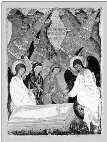
Жены-мироносицы. Икона XV века.