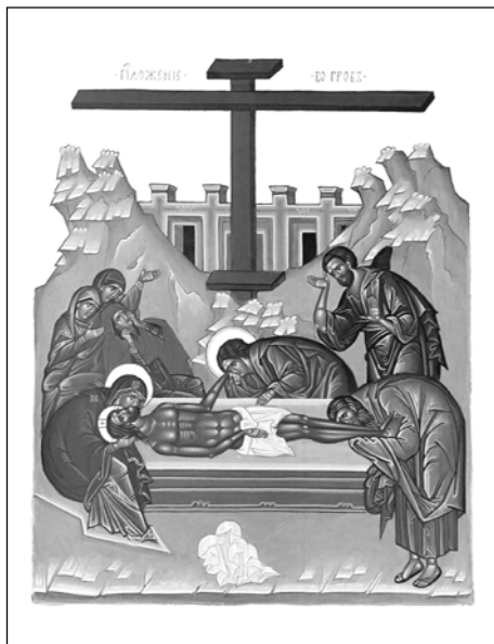
Положение во гроб. Сийская иконописная мастерская.

Нелепость выдумки бросается в глаза всякому, не потерявшему здравого смысла. Совершенно недопустимо, что стража могла уснуть — где же военная дисциплина? Это ведь «стража римская», а римская армия по своей железной дисциплине и храбрости была одной из самых лучших армий мира. Если воины спали, то не могли видеть, а если видели, значит, не спали. В таком случае они не дали бы совершить «похищение», напротив, задержали бы похитителей и вместе с полчищем — мертвым телом — представили бы начальству. Но если бы похищение и удалось, разве убийцы Христа оставили