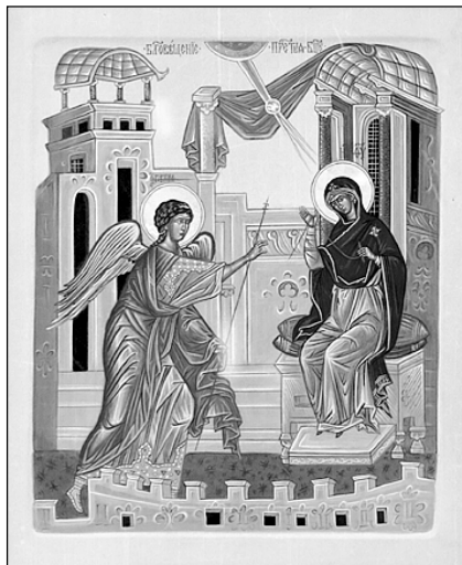
Благовещение. Сийская иконописная мастерская.

Ни единым словом не усомнилась и не воспрекословила Пречистая Дева на извещение Архангела Гавриила о воплощении от Нее Сына Божия — сколько же смирения и доверия, послушания и преданности Господу прозвучало в Ее ответе: «Се, раба Господня, да будет Мне по слову твоему (Лк. 1, 38).