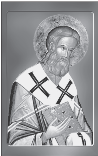
Святитель Филарет (Дроздов). Икона конца XIX в.

Святой апостол Матфей, из числа 12 апостолов, был мытарем — сборщиком податей для Рима среди иудеев. Услышав призыв Христа: «Иди за Мною», последовал за Спасителем, стал свидетелем Его чудес, Крестной смерти и Воскресения. После Пятидесятницы проповедовал в Палестине, Сирии, Персии и других странах, закончил проповеднические труды мученической кончиной в Эфиопии. Автор Евангелия от Матфея — богодухновенного повествования о земной жизни и учении Иисуса Христа.